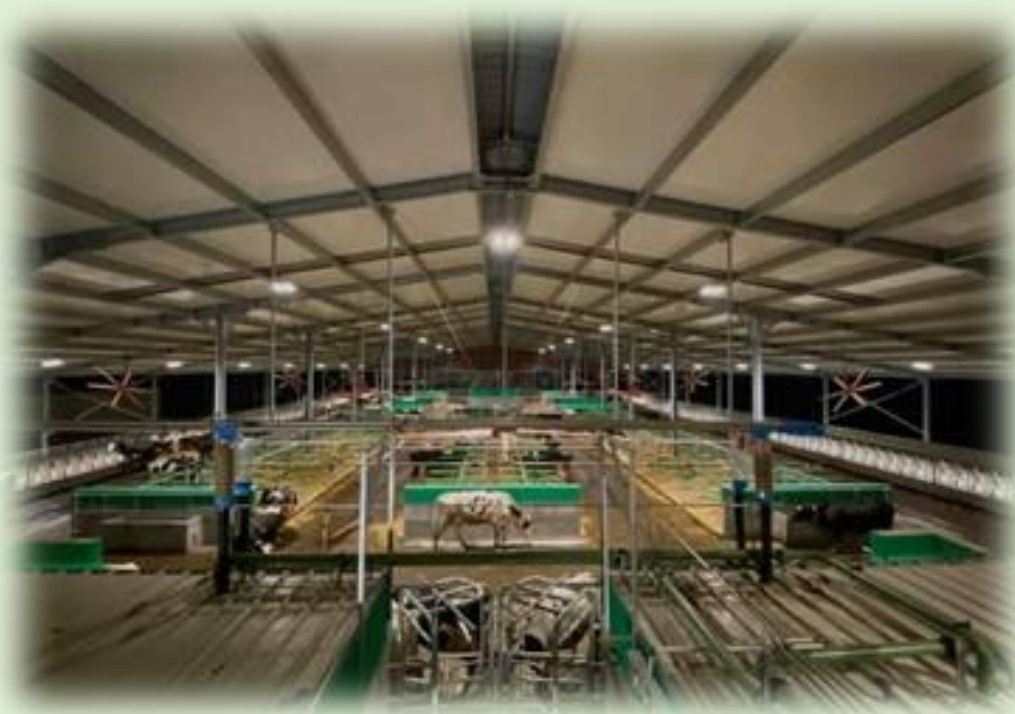
Effluenti zootecnici (4000/4500 capi)