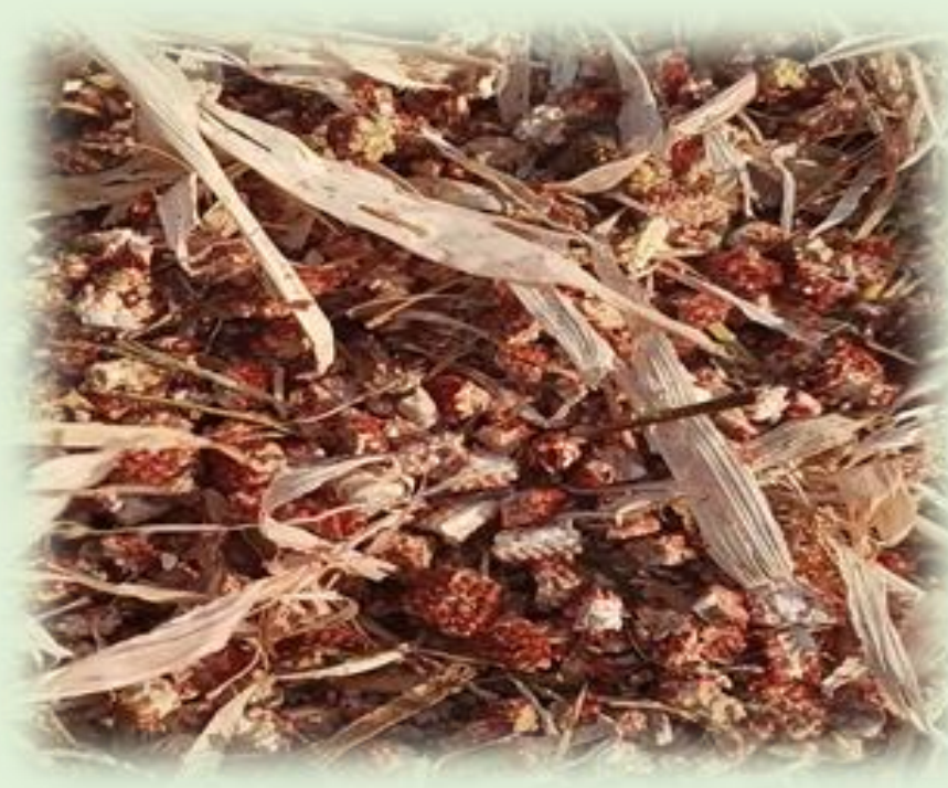
Tutoli - Triticale – Sorgo - Scarti di essiccazione dei cereali- Sansa di oliva - Stocchi di mais